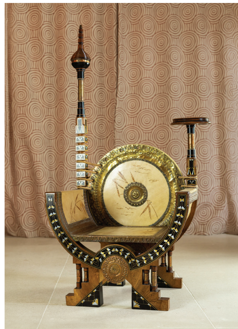
Fauteuil trône homme En bois noirci et acajou incrusté de cuivre Assise : 51 x 68 cm Hauteur 1,47 m