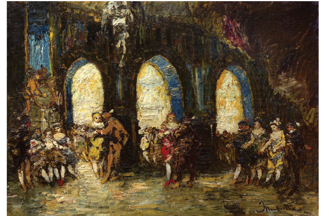
Le bal costumé Huile sur bois Signée en bas à droite 46 x 66 cm