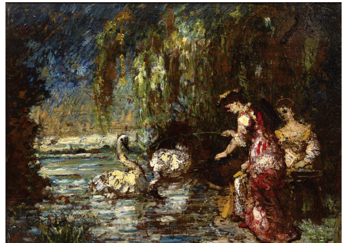
Jeunes femmes aux cygnes Huile sur bois Signée en bas à droite 37 x 48 cm