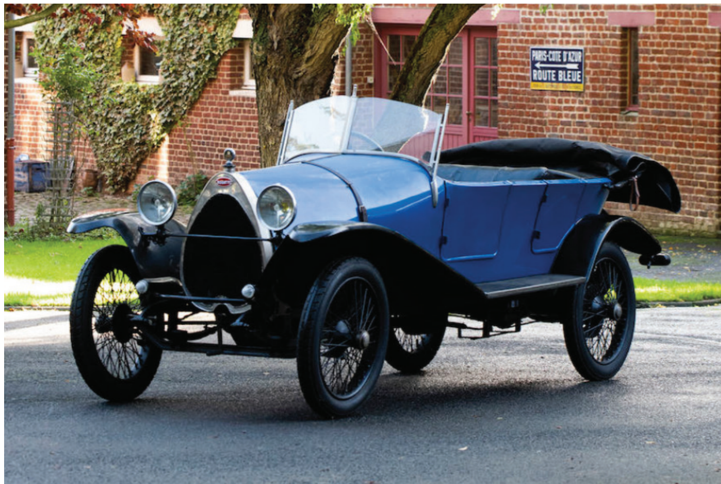
Bugatti Type 23 1922 Châssis 1573