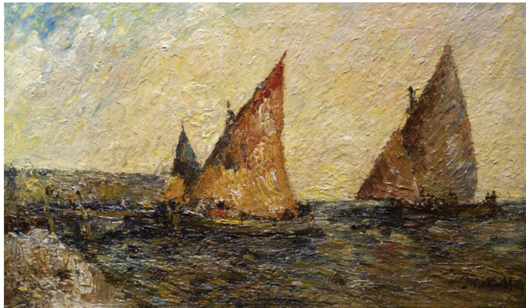
Les barques de pêche Huile sur bois Signée en bas à droite 39,4 x 62,8 cm