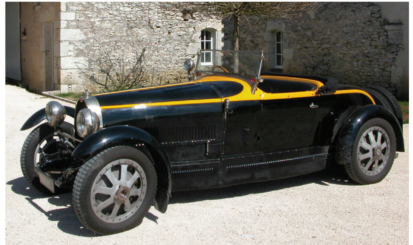
Bugatti 43 Ayant appartenu à Leopold II, Roi des belges 1930 Châssis 43306