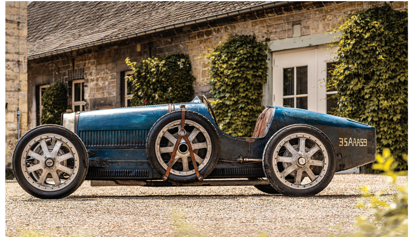
Bugatti Type 35 Grand prix de Lyon 1924 Châssis 4449