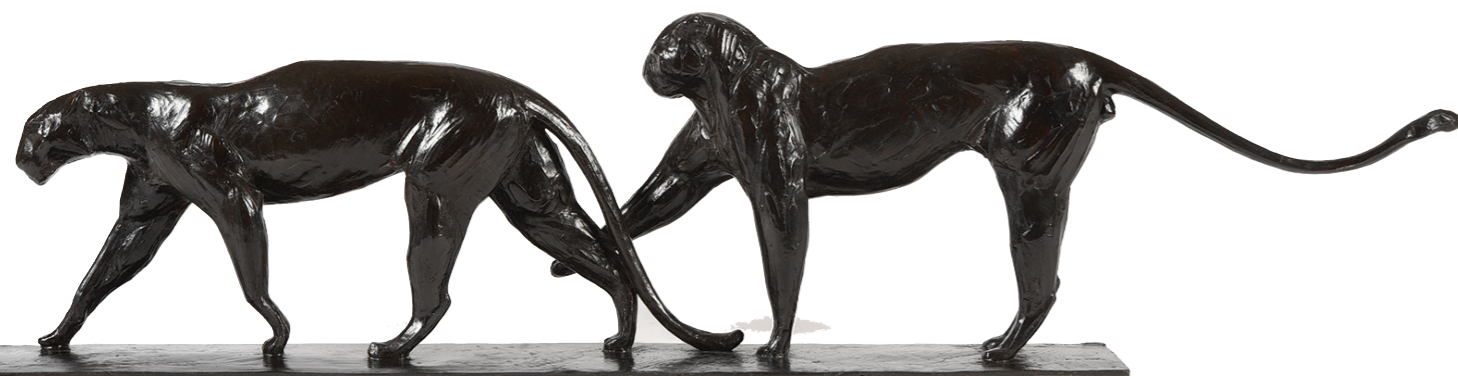
Deux léopards marchants Modèle conçu circa 1912. Épreuve en bronze à patine brune signée « R. Bugatti ». Cachet du fondeur « Cire/perdue / A. A Hebrard, Fonte Albino Palazzolo », numérotée « A2 » sur la terrasse. 23 x 93 x 11 cm.