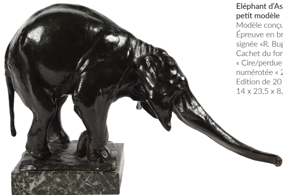
Éléphant d'Asie, « Il y arrivera » petit modèle Modèle conçu vers 1907. Épreuve en bronze à patine brune signée «R. Bugatti». Cachet du fondeur « Cire/perdue / A. A Hebrard », numérotée « 20 » sur la terrasse. Edition de 20 exemplaires. 14 x 23,5 x 8,3 cm